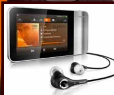
PHILIPS Zaštitnik vašeg sluha