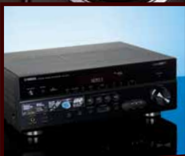
YAMAHA Stalno usavršavanje