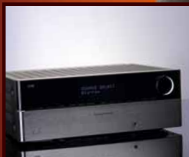
HARMAN/KARDON Smena generacija