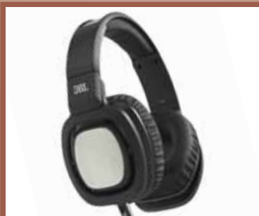
JBL Bas pre svega