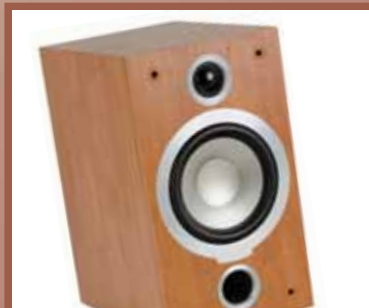
TANNOY Najpopularniji model