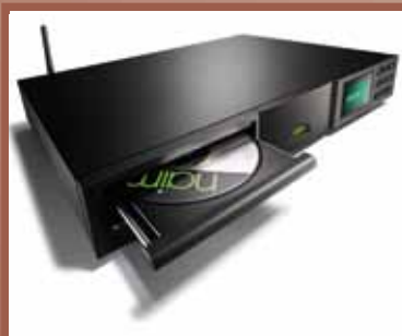
NAIM Sve je lako uz Naim